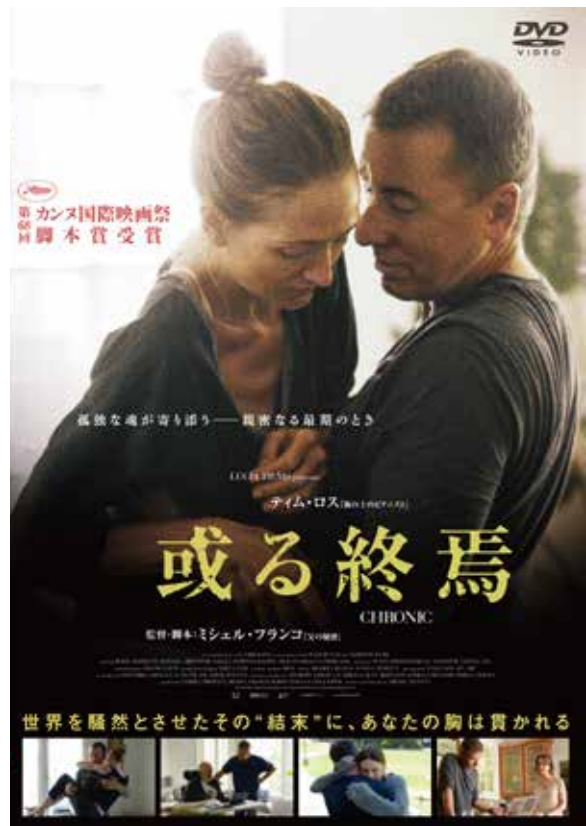
©Lucía Films - Videocine - Stromboli Films - Vamonos Films - 2015 ©Crédit photo ©Gregory Smit

荒川館カウンターまたは図書館HPの申込フォームよりお申し込みください。お申し込みいただいた方に上映会チケットを配布いたします。